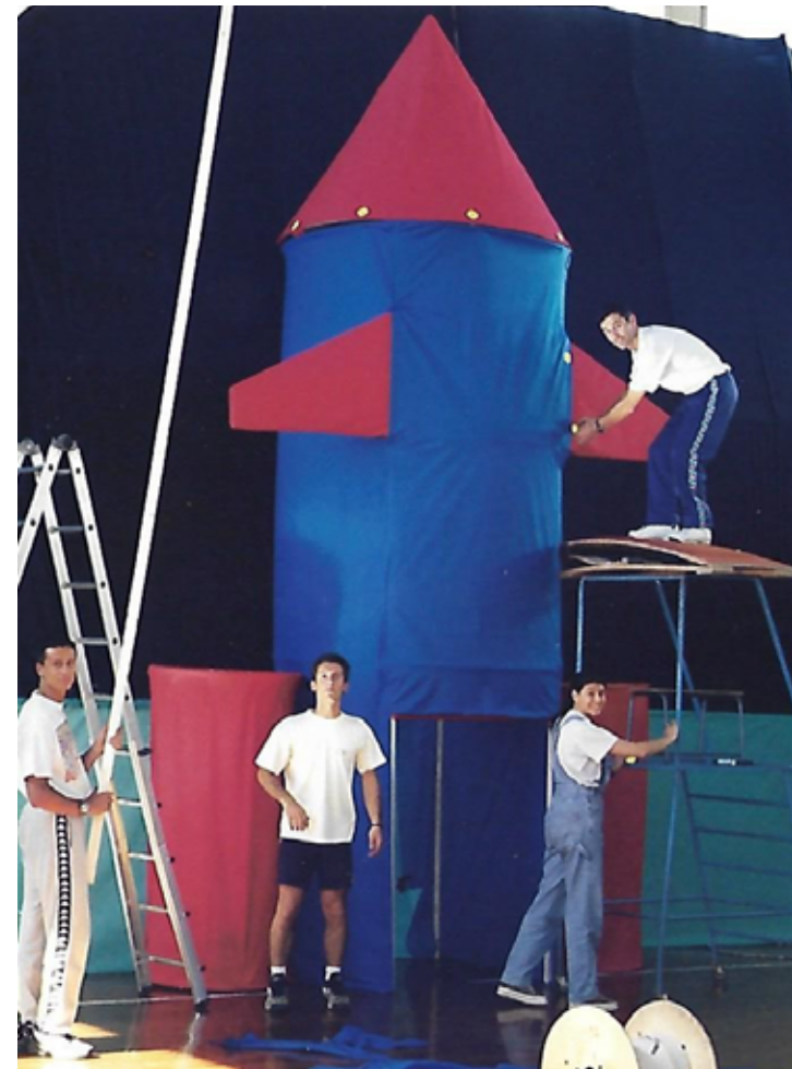
1998 Costruzione scenografia saggio

Il nostro lavoro ha sempre trovato e trova motivazione, gratificazione ed energia, nel quotidiano rapporto con i giovani di tutte le età, di tutte le etnie, di tutte le classi sociali, di tutte le capacità e abilità motorie. Giovani e meno giovani che continueranno negli anni a frequentare i nostri corsi di ginnastica, troveranno nel tempo degli istruttori prima di tutto educatori, amici sempre pronti al dialogo, alla comprensione, a sostenere le difficoltà soggettive e oggettive più comuni e reali.