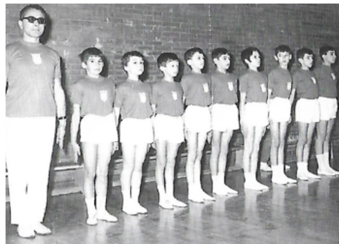
1969 Roma 1ª Squadra agonistica