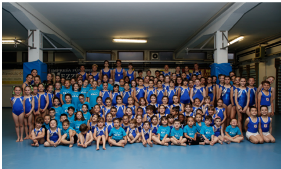
2017 Gruppo Libertas

La scelta educativa di tutto lo staff Libertas e il nostro saluto di ogni fine anno sportivo è il saggio dedicato alle famiglie nella speranza che non solo sia accettato con gioia e rispetto, ma nella speranza che sia raccontato nel tempo per permettere a chi verrà di potersi sentire protagonista assoluto della propria crescita e di una storia Libertas che merita di continuare con lo stesso ardore nel tempo.