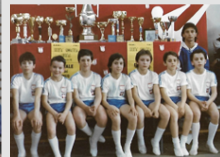
1988 Agonistica maschile

Nel 1985 si dà vita a un nuovo corso di ginnastica ritmica e l'attrezzatura necessaria (solo piccoli attrezzi) è facilmente accessibile per le casse della nostra società, ma purtroppo l'affluenza risulta limitata a poche unità e pertanto questa nuova esperienza dura solo un quadriennio.