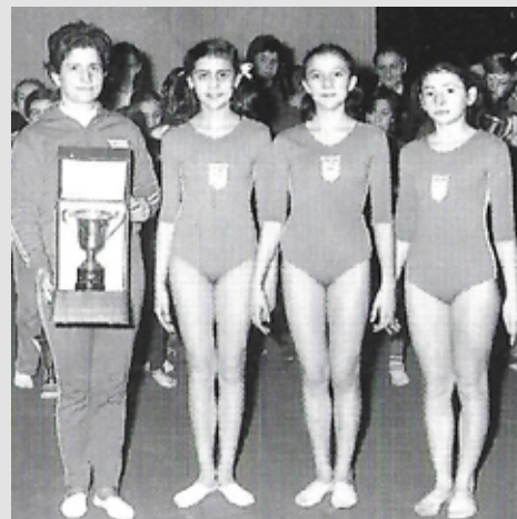
1972 Agonistica femminile

Prosegue a pieno ritmo l'attività preparatoria e agonistica con una costante e proficua partecipazione a manifestazioni regionali, interregionali e nazionali delle due sezioni femminile e maschile. I risultati sono incoraggianti sia a livello individuale che di squadra, numerose manifestazioni vengono organizzate nel palazzetto dello sport galliatese, con un successo di pubblico e tanti complimenti per la logistica.