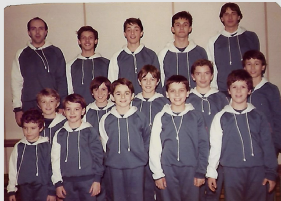
1985 agonistica maschile

Libertas Galliate scuola di ginnastica e di vita. Prestigiosa partecipazione a un'attività regionale, interregionale e nazionale con buoni risultati di atleti e atlete in tutte le categorie, sempre in evidenza nella vetrina delle manifestazioni federali. Non mancano campioni regionali nella categoria allievi e allieve nelle competizioni individuali e di squadra. In questi anni la specialità ginnastica è diventata una disciplina in continua evoluzione e sempre più dipendente dagli organi internazionali che aggiornano continuamente codici di difficoltà. Queste peculiarità obbligano le società con squadre agonistiche a dover disporre di mezzi che non tutti possono concretizzare nelle proprie realtà locali.