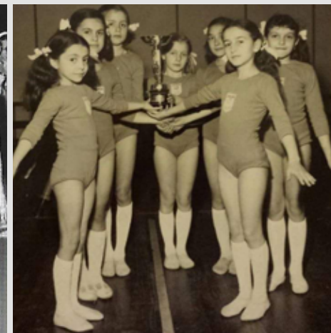
1972 Squadra femminile