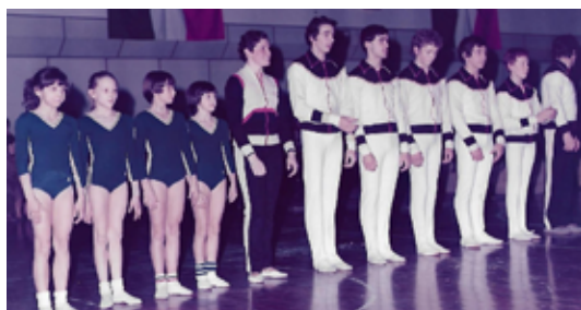
1978 Decennale squadre nazionali giovanili