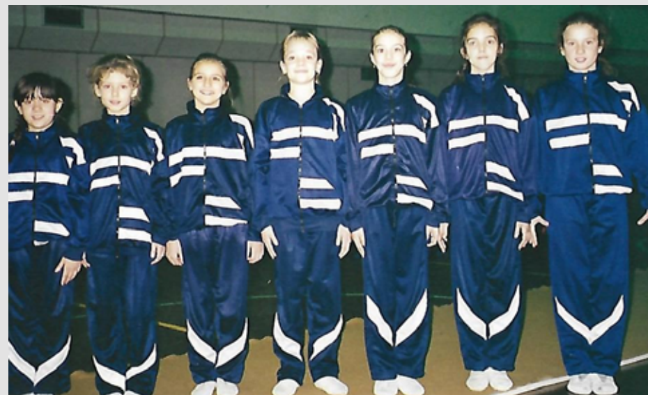
1996 Squadra femminile