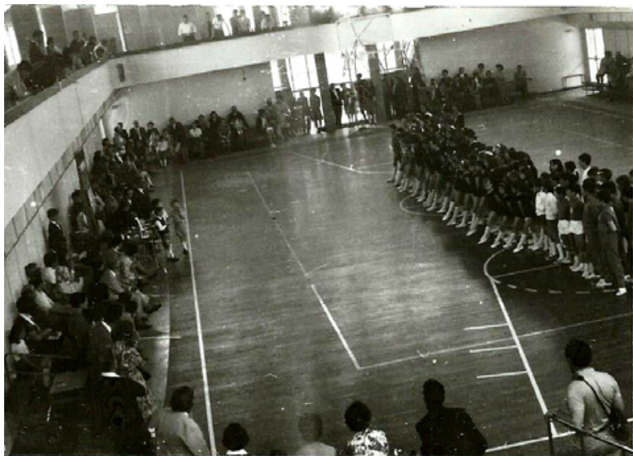
1968 1° Saggio

Ha luogo il primo saggio della Libertas che riscuote immediatamente un grande successo, lo sport rivolto ai più giovani è una innovazione e una curiosità molto appetibile per questi tempi.