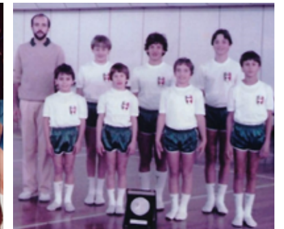
1982 Campioni regionali