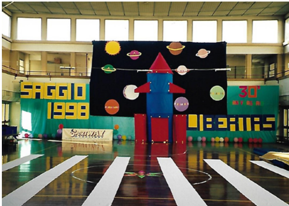
1998 Scenografia saggio

Ormai l'evoluzione tecnica impone l'utilizzo di attrezzature con caratteristiche particolari e molto costose, una quantità di ore di allenamento difficilmente sostenibili e attuabili da tutti.