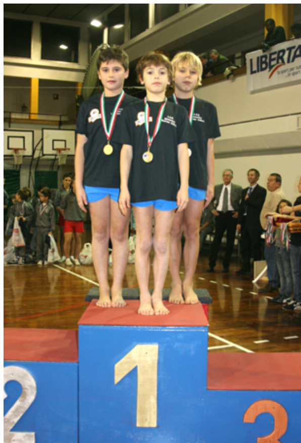
2010 Campioni Nazionali Libertas

In questi anni la nostra società con i suoi migliori ginnasti, accede alle finali nazionali di gare organizzate dalla FGI e anche da altre associazioni in un contesto promozionale, ma ugualmente molto tecnico e selettivo, siamo costantemente presenti sul podio nelle varie specialità. Novembre 2013 ore 8:30 fuori dal palazzetto dello sport un'aria gelida e un leggero nevischio, ci ricordano che è arrivato il giorno del "Campionato Nazionale Libertas" perché per il quinto anno consecutivo, qui si organizza questa manifestazione e, come se il tempo si fosse fermato, ci ricorda sempre anche l'arrivo dell'inverno.