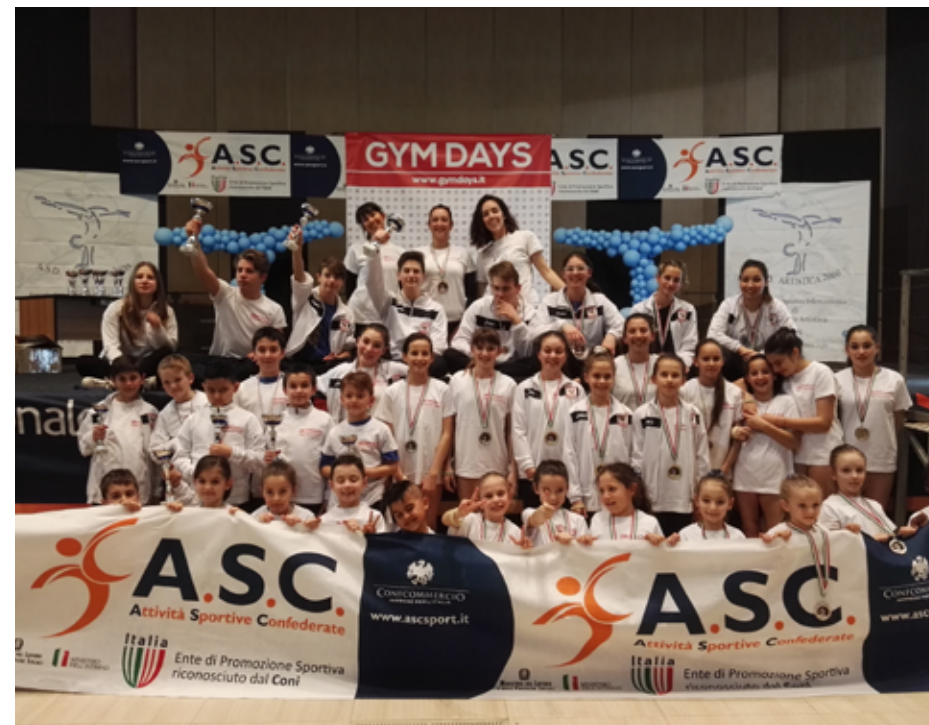
2016 Gruppo agonistico

Questo anno sportivo 2017 , vigilia del cinquantesimo della fondazione, è stato un anno molto importante oltre che per i risultati ottenuti nelle gare promozionali (più di un ginnasta del settore maschile e femminile e per ogni categoria, qualificati nelle finali nazionali nelle quali abbiamo gareggiato con performance di qualità) anche per le scelte da parte del consiglio direttivo di nuovi quadri tecnici, i quali hanno risposto con un impegno rinnovato e cresciuto sia nella parte tecnica sia in particolare in quella emotiva, con una maggior carica di empatia che ha trascinato