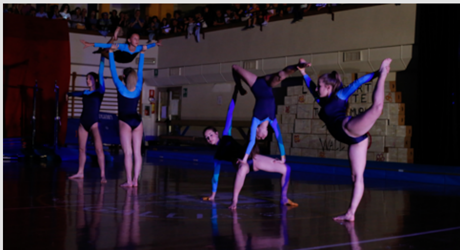
2017 Coreografia saggio