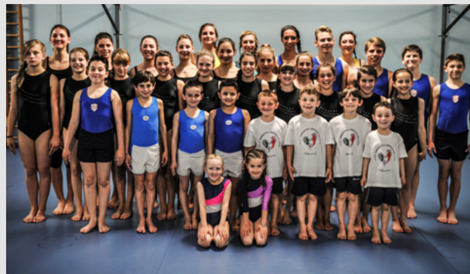
2014 Gruppo agonistico

In tanti ci chiedono di riorganizzare ugualmente la manifestazione, ci assicurano la loro presenza e collaborazione, nasce così il 1° trofeo città di Galliate , il lavoro svolto fin qui ci premia e Galliate continua a essere una tappa ambita nel calendario sportivo.