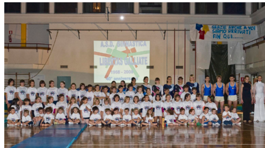
2008 - 40° Anniversario

Due giorni indimenticabili con la voglia di raccontare e raccontarsi, un salto di fatto nel passato non solo con i ricordi e con l'anima, ma anche con il corpo. Non più solo singoli personaggi, ma per molti di loro famiglie legate tutte al nostro sodalizio da un vincolo che va ben oltre l'amicizia.