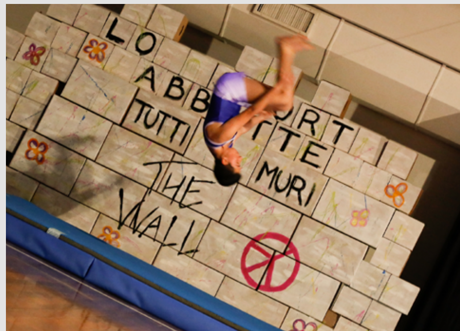
2017 Slogan saggio

Circa 150 atleti dai 3 anni in su si sono esibiti accompagnati dalle note dei Pink floyd in un ambientazione illuminata da una miriade di luci colorate ed effetti laser che hanno reso piacevole ed emotivamente carica una serata che non verrà dimenticata negli anni a venire. Un muro “the wall” costruito con tanti mattoni sul quale si evidenziava la scritta “lo sport abbatte tutti i muri” è stato fatto cadere da tutti i ragazzi al termine del saggio per trasmettere un messaggio educativo che condiviso tra gli atleti veniva approvato anche dal pubblico presente. Un pubblico mai annoiato, nonostante l'ora tarda sarebbe rimasto ancora ad ammirare, ascoltare e applaudire con la stessa energia di inizio serata.