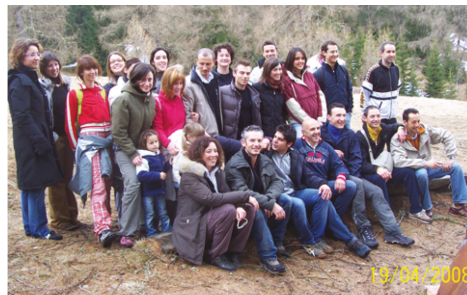
2008 Ex ginnasti Val di Non