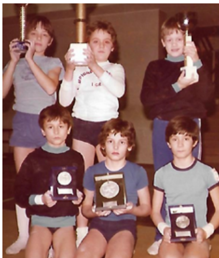
1978 Agonistica allievi