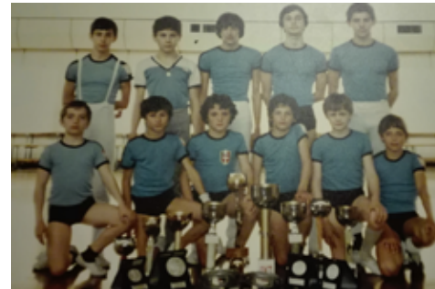
1979 Agonistica maschile