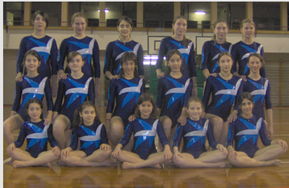
2005 Gruppo agonistico

I genitori stessi a volte danno alla palestra una responsabilità che supera l'aspetto ludico sportivo ed educativo, pretendono più di quanto la palestra può umanamente offrire e non mancano atteggiamenti da parte loro, ingiustamente inopportuni, che hanno come conseguenza l'interruzione di un percorso senz'altro costruttivo per una crescita sana dei loro figli. La Libertas nonostante tutte queste difficoltà, permane un'isola dove si cerca di annullare ogni tipo di pressione negativa, lo si intuisce quando si condividono i suoi momenti, i suoi spazi, sempre vivi e colorati, con i rumori delle pedane, dei trampolini, dei grandi attrezzi che trasudano di emozioni già vissute da generazioni passate e presenti.