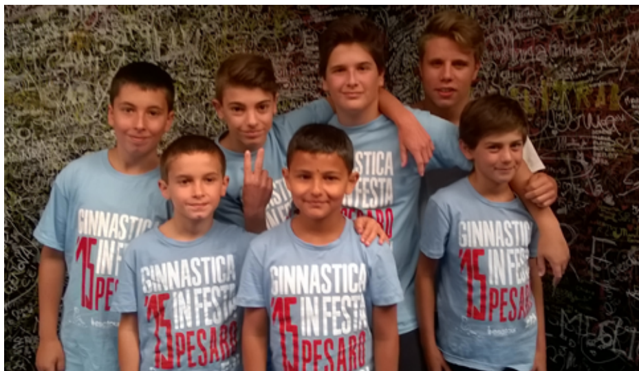
2015 Pesaro Finale Nazionale Gpt

Un palazzetto come tanti, poche risorse, ma smisurata passione e ancora una volta la libertas Galliate è riuscita a colpire non solo per l'ottima organizzazione nell'aspetto tecnico, ma è riuscita a coinvolgere emotivamente atleti e pubblico che negli anni sono diventati amici, amici anche della ginnastica e insieme, rappresentano un valore aggiunto che non può che aiutare a crescere.