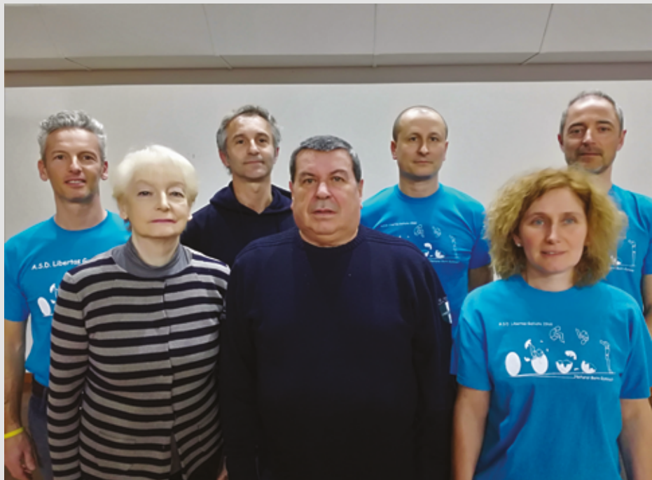
2018 Consiglio Direttivo