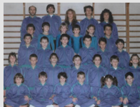
1988 Gruppo agonistico maschile e femminile