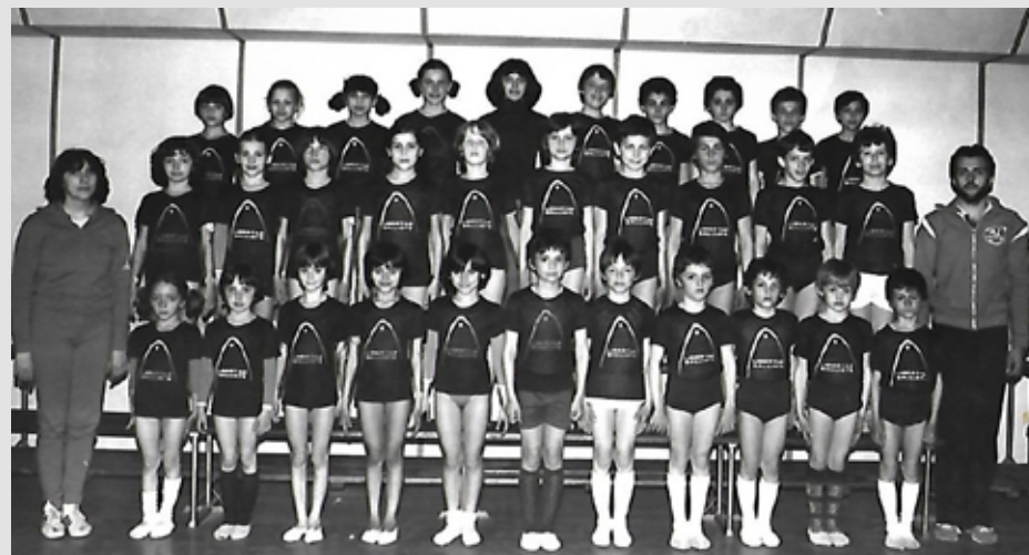
1976 Gruppo agonistico