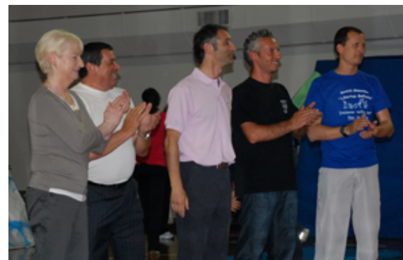
2013 Consiglio Direttivo

La manifestazione ha inizio e da subito all'interno del palazzetto, prende vita al contrario un clima caldo e carico di emozioni. Le prime squadre danno inizio