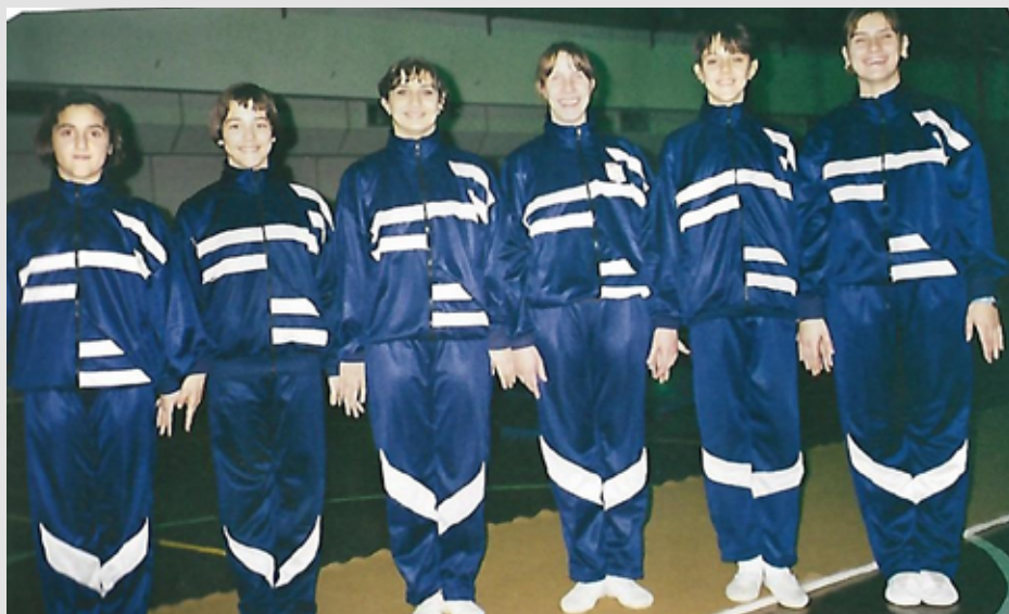
1996 serie b femminile