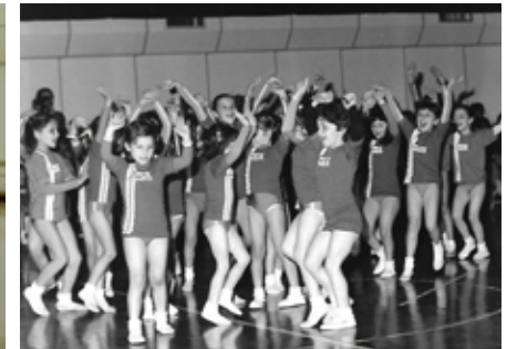
1981 Saggio formativa