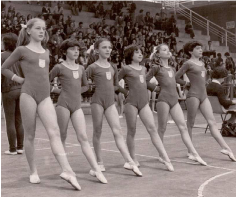
1980 Squadra agonistica femminile